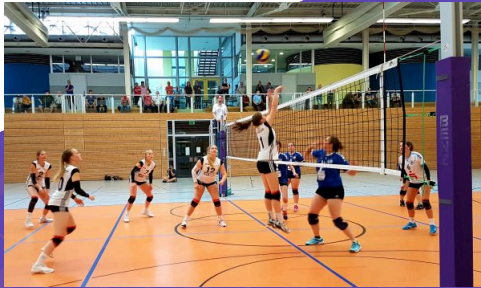
3-Felder-Halle des Sportgymnasiums